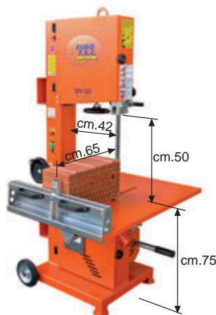
Taglio utile - Useful cut nützlicher Schnitt

cod. SPH505R Schiebebank 71x106 cm Schwungrad Durchmesser 440 mm rad mm.200 - gewicht Kg. 220 Antrieb durch den Getriebemotor: - Einphasen Kw 1,4 - Dreiphasen Kw 1,8 Säge Widia USA 41x3850mm Obere und untere Sägeblattführung aus Widia. Schallleistungspegel: -Schneiden von Gasbeton 74dB(A) -Schneiden von Poroton 87 dB(A)