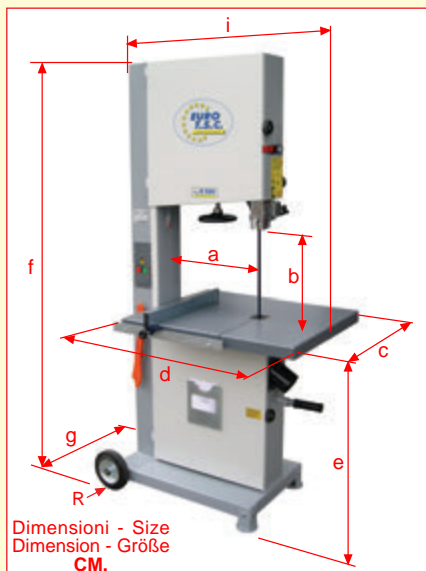
Dimensioni - Size Dimension - Größe CM.